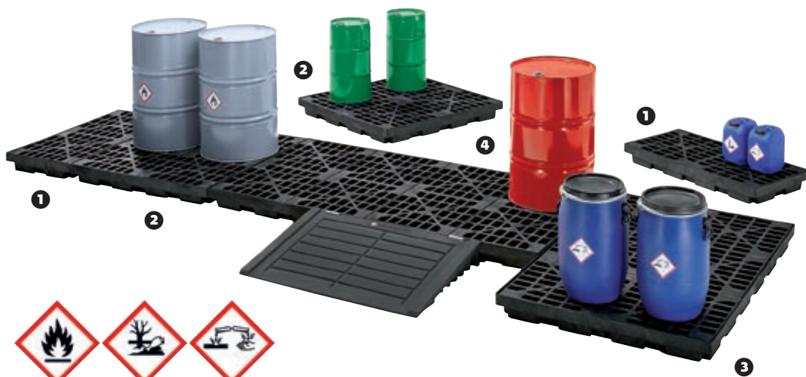
rys. z rampą najazdową i zestawami łączącymi