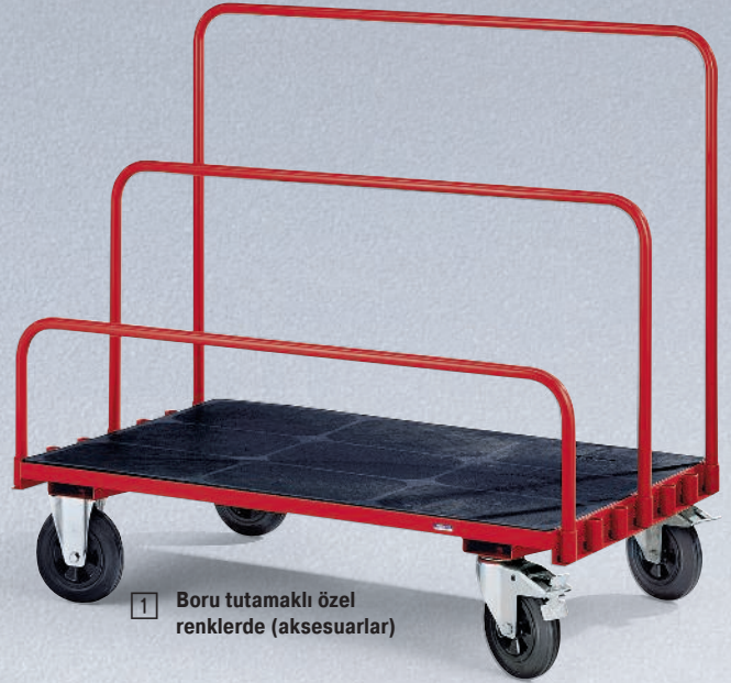
1 Boru tutamaklı özel renklerde (aksesuarlar)

Neredeyse her RAL renginde mevcuttur. Fiyat farkı sadece %10!