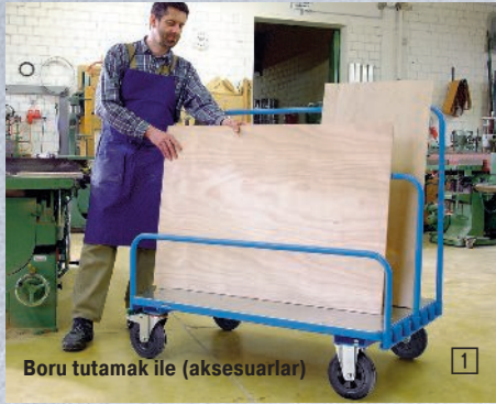
Boru tutamak ile (aksesuarlar)