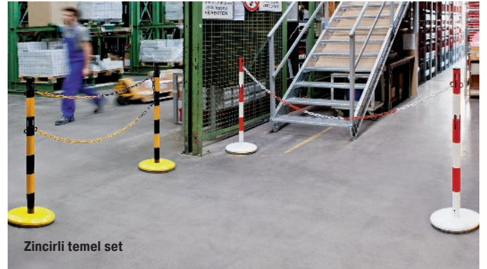
Zincirli temel set