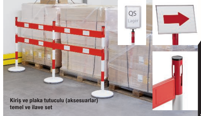
Kiriş ve plaka tutuculu (aksesuarlar) temel ve ilave set