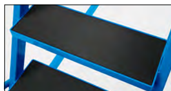
Stupne s ryhovanou gumou