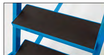
Stupne so špeciálnou preglejkovou doskou