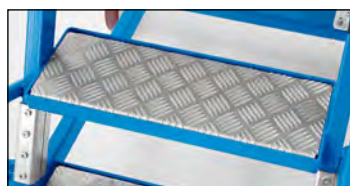
Stupne s ryhovanými hliníkovými