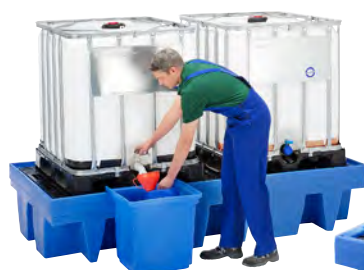
22 S predсаденоu nádobou na stáčanie z PE (prislušenstvo)

U Všeobecné schválenie stavebného dozoru DIBt, Berlín (Nemecký inštitút pre stavebnú techniku)