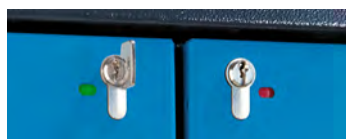
Prikaz za odklenjeno/zaklenjeno