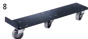
8 | Transportne plošče

Dolžina: 600 mm. Širina: 140 mm. Višina: 130 mm. Teža: 8.2 kg. Teža na kos: 4.1 kg. Uporaba: različno. Dob. enota: 2.