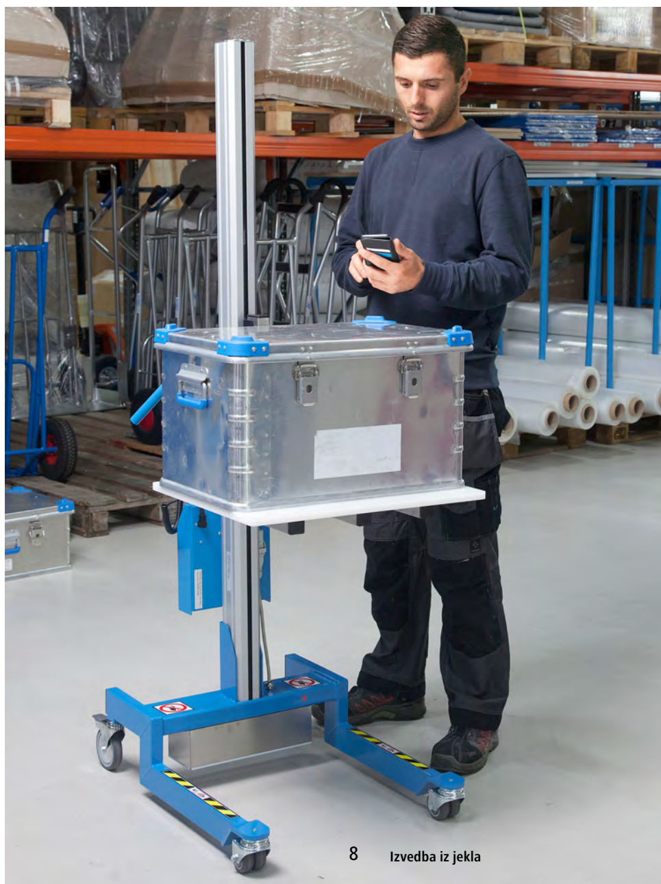
8 Izvedba iz jekla