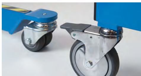
4 vrtljiva kolesa za odlično pomikanje, sprednji kolesi z zavoro