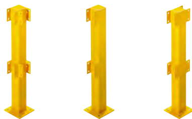
Угловая стойка Конечная стойка Средняя стойка