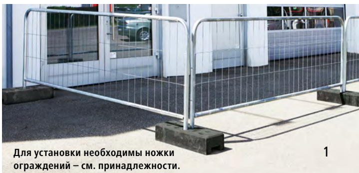
Для установки необходимы ножки ограждений – см. принадлежности.