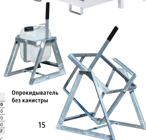
Опрокидыватель без канистры