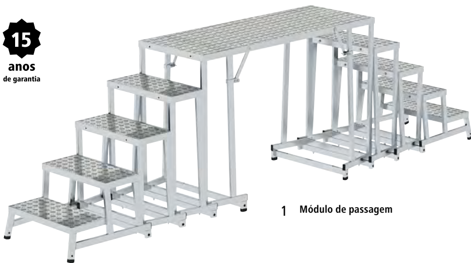
1 | Módulo de passagem