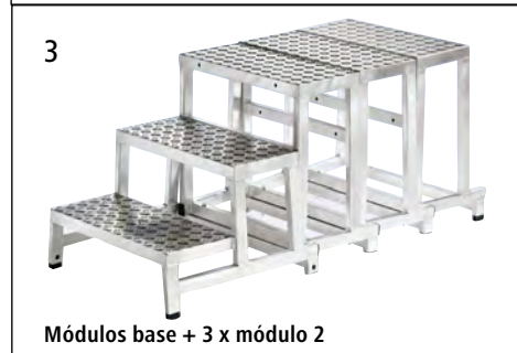
3 | Módulos base + 3 x módulo 2