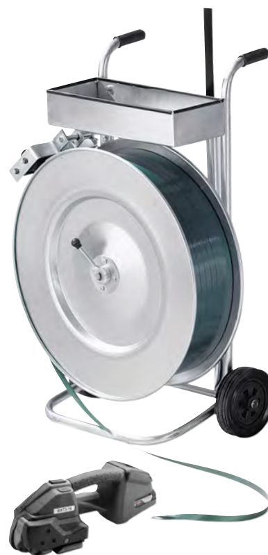
Todos os componentes podem ser encomendados individualmente.

Resistência à rutura: 650 kg/cm 2 . Espessura do material: 0,85 mm. Tipo de fecho: sem grampos. Comprimento da fita: 1200 m. Versão do desenrolador de fita: móvel, com depósito. Cor dos desenroladores de fita: galvanizado. Ø do núcleo: 406 mm.