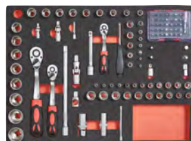
108 peças – chaves de caixa