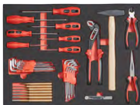
37 peças – ferramentas manuais