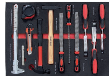
4 Universele gereedschapsset 28-delig