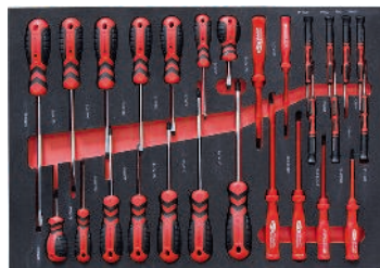
3 Schroevendraaierset 21-delig