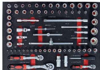
2 Steeksleutelset 63-delig