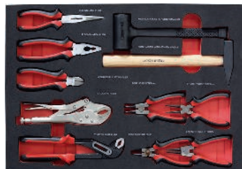
5 Tangen-/hamerset 11-delig