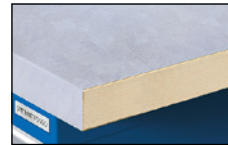
Blad met plaatstalen toplaag – multiplex middenlaag met 1,5 mm dikke, verzinkte plaatstalen toplaag, ongevoelig voor oliën, vetten enz.