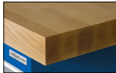
Massief beukenhouten blad – duurzaam, sterk en meervoudig schuurbaar

Levering ongemonteerd – eenvoudig zelf te monteren.