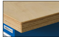
Beukenhouten multiplexblad – sterk en trekt niet krom