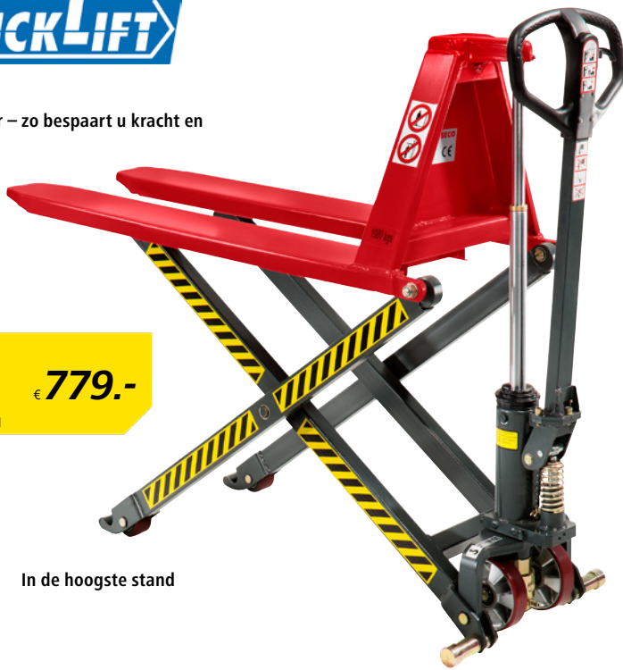
In de hoogste stand

Heft sneller – zo bespaart u kracht en tijd!