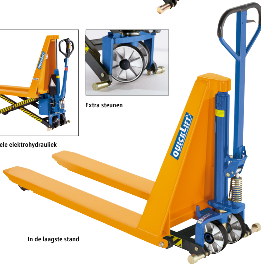
In de laagste stand