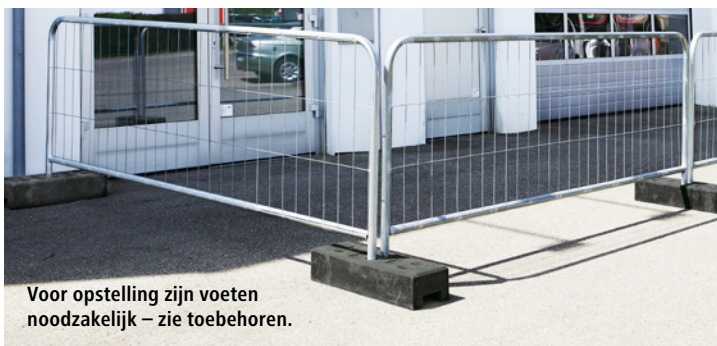
Voor opstelling zijn voeten noodzakelijk – zie toebehoren.