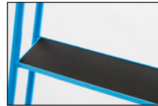
Treden en platform met plaatmateriaal met antislip oppervlak