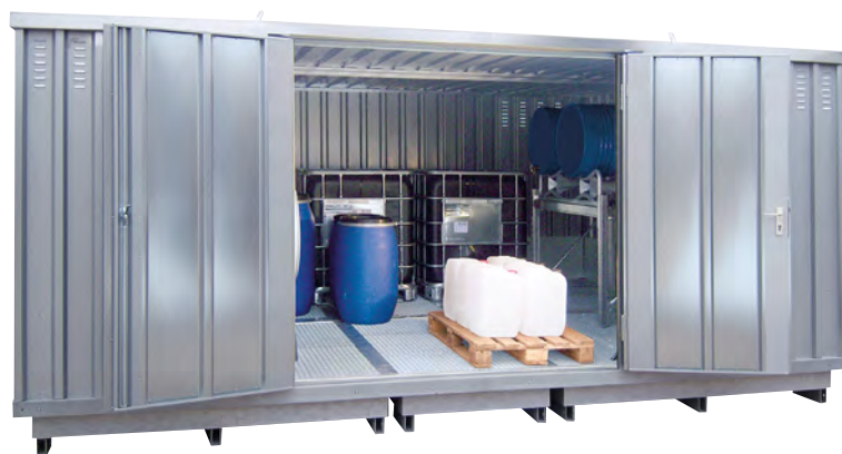
20 Uitvoering verzinkt

Materiaal: profielstaal. Vloeruitvoering: thermisch verzinkte opvangbak met rooster, belasting 1000 kg/m 2 bij verdeelde last. Sluiting: veiligheidsslot. Oppervlak: verzinkt. Type deur: dubbele vleugeldeuren. Deurhoogte: 1900 mm. Keurmerk: standaarduitvoering met constructiekeurmerk (DiBt, Berlijn). Gevarenklassen: voor actieve opslag van ontvlambare stoffen in de GHS-categorieën 1 – 3.