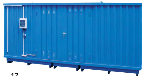
17 Extra gelakte buitenkant (meerprijs)