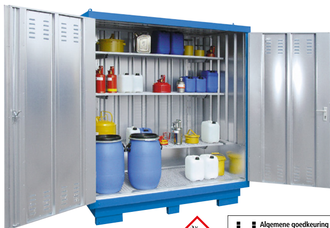
Gelakte buitenkant (meerprijs), stellingset (zie toebehoren)