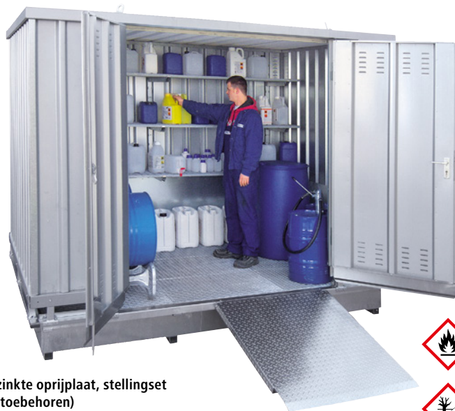
Verzinkte oprijplaat, stellingset (zie toebehoren)