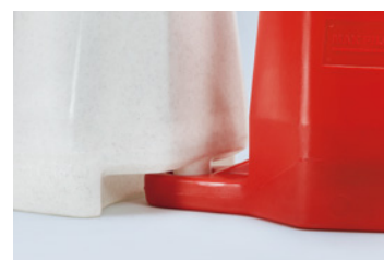
Collegamento a innesto