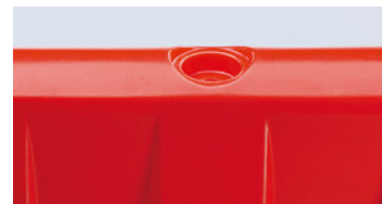
Da riempire con acqua o sabbia