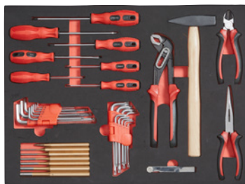
37 elementi – utensili a mano

Per larghezza: 490 mm. Per profondità: 340 mm.