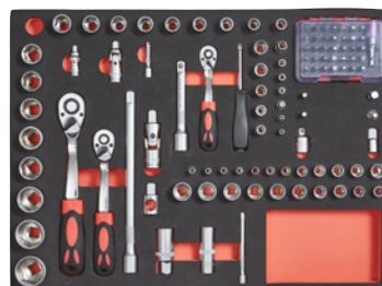
108 elementi – chiavi a bussola