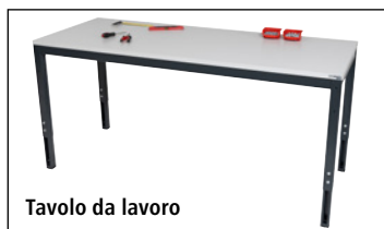
Tavolo da lavoro