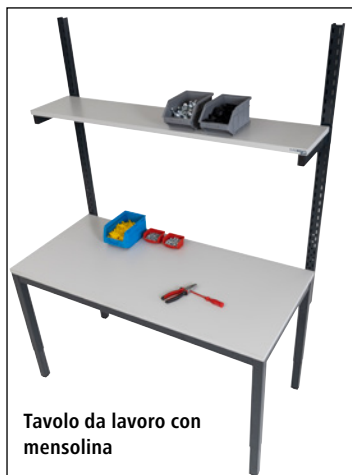
Tavolo da lavoro con mensolina