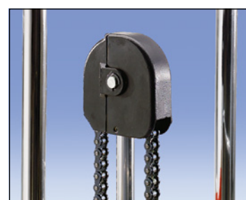
Massima sicurezza: rulli guida protetti