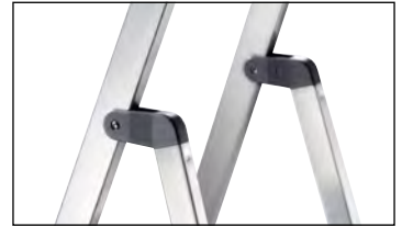
Szárat körülvevő csuklórendszer