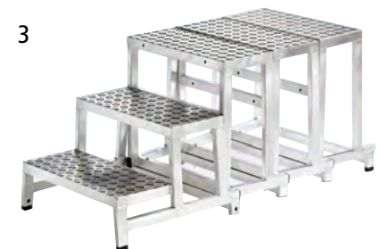
3 Osnovni moduli + 3 x modul 2