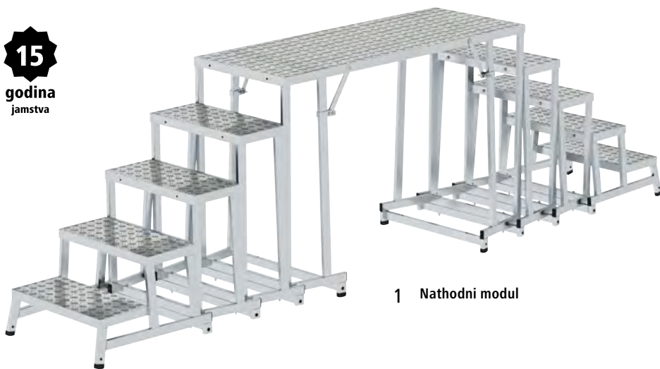
1 Nathodni modul