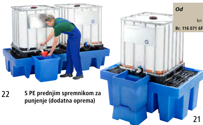
22 S PE prednjim spremnikom za punjenje (dodatna oprema)

U Odobrenje opće inspekcije za zgrade DIBt, Berlin