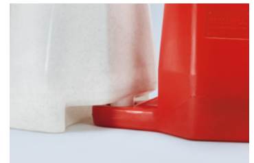
Liaison par emboîtement