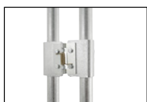
Kits de montage pour charnières de porte