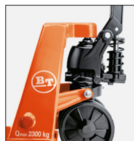
Transpalette BT Lifter QuickLift