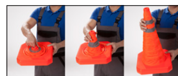
Lot de 2.