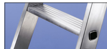
Avec marches striées antidérapantes, profondeur 80 mm