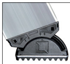
Articulation mobile avec technologie brevetée d'inclinaison sur 2 axes