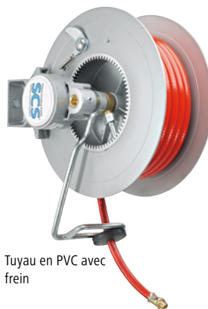
Tuyau en PVC avec frein

Domaine d'utilisation: pour air. Pression max. jusqu'à: 15 bars. Diamètre nominal du flexible: DN 10. Raccord extérieur: G 3/8 pouces. Matériau du corps: fonte d'aluminium. Modèle de fixation: fixations possibles :murale, au plafond, au sol, sur des machines et des véhicules. Mécanisme: ressort de rappel et dispositif de blocage. Largeur: 166 mm.