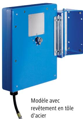
Modèle avec revêtement en tôle d'acier

Domaine d'utilisation: pour air, eau ou huile. Pression max. jusqu'à: 60 bars. Diamètre nominal du flexible: DN 12. Raccord extérieur: G 1/2 pouces. Matériau du corps: laqué avec galvanisation partielle. Modèle de fixation: fixations possibles :murale, au plafond, au sol, sur des machines et des véhicules. Mécanisme: ressort de rappel et dispositif de blocage. Version: sans frein double SCS®.