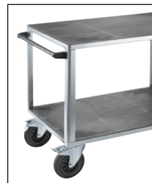
Deux plateaux avec châssis roulant galvanisé