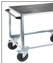
Un plateau avec châssis roulant galvanisé

Nombre de plateaux: 2. Train de roulement: 2 roulettes pivotantes avec blocage double, 2 roulettes fixes. Ø roues: 200 mm.