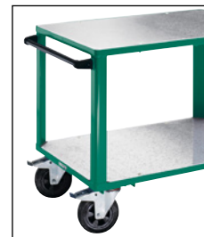
Deux plateaux revêtus de tôle d'acier galvanisée