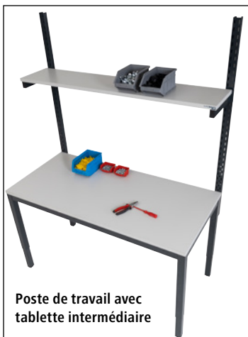
Poste de travail avec tablette intermédiaire