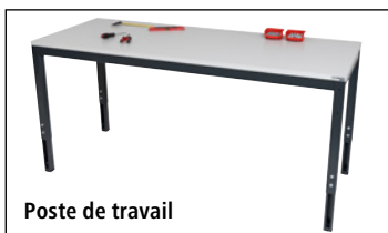
Poste de travail