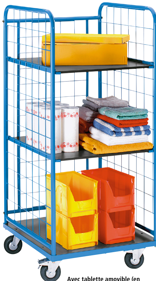
Avec tablette amovible (en accessoire)