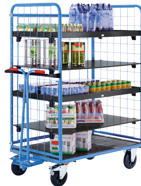
Avec timon manuel, tablette intermédiaire sans rebords et tablette avec rebords (en accessoires)