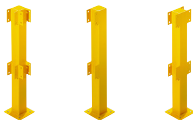
Poste esquinero Poste de los extremos Poste central

Forma: rectangular. Color: amarillo. Material: acero. Tipo de fijación: con placa de base para atornillar. Longitud de la placa: 200 mm. Anchura de la placa: 200 mm. Grosor de la pared: 3 mm. Forma del tubo: rectangular.