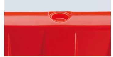
Se puede rellenar con agua o arena