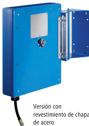
Versión con revestimiento de chapa de acero

Área de aplicación: para aire, agua o aceite. Presión máx. hasta: 60 bar. Anchura nominal de la manguera: DN 12. Conexión exterior: G 1/2 pulgadas. Material de la carcasa: pintado con galvanizado parcial. Posibilidad de fijación: es posible la fijación a la pared, techo, suelo, máquinas y vehículos. Mecanismo: resorte de recuperación y posibilidad de inmovilización. Modelo: sin freno doble SCS®.