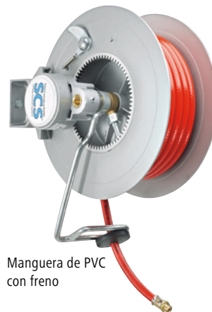
Manguera de PVC con freno