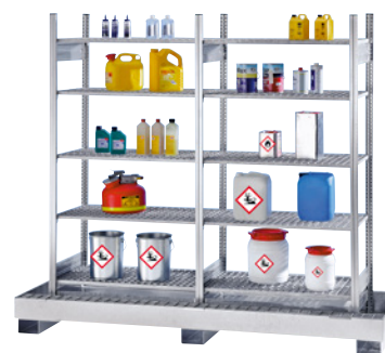
18 Con accesorio

Envío gratuito en 80.000 artículos (Península).