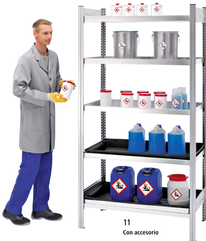
11 Con accesorio

Carga por balda: 130 kg. Altura total: 2000 mm. Profundidad total: 635 mm. Categorías de peligrosidad: para sustancias contaminantes del agua y no inflamables de las categorías GHS 1 – 4. Intervalo de ajuste de los niveles de balda: 25 mm. Construcción: ensamblable. Material: chapa de acero, galvanizado. Número de cubetas: 4 unid.