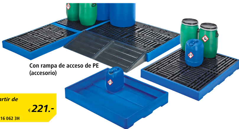
Con rampa de acceso de PE (accesorio)

Altura: 150 mm. Material: polietileno. Signo de homologación: homologación general de control DiBt, Berlín. Categorías de peligrosidad: para sustancias contaminantes del agua de las categorías GHS 1 – 4.