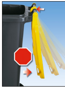
Mit Rückschlagdämpfung für geräuscharmes Öffnen

Material Abfallbehälter: Polyethylen (Niederdruck-PE / HDPE). Ausstattung: mit Deckel. Eigenschaft: fahrbar. Radausstattung: 2 Räder. Rad-Ø: 200 mm. Norm: DIN EN 840. Radmaterial: Gummi.