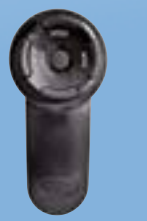
3 + 4