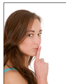
Sensationell leise, unter 60 db