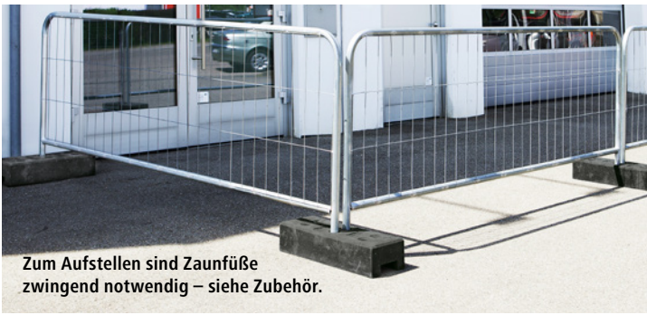
Zum Aufstellen sind Zaunfüße zwingend notwendig – siehe Zubehör.