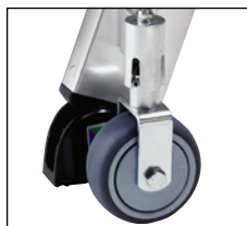
Mit vier lastabhängigen Bremsrollen