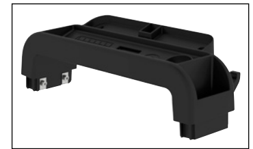
Praktische Ablageschale mit Eimerhaken für Werkzeug und Material

Aufstieg: einseitig. Ausführung Aufstieg: Stufen. Gestellmaterial: Aluminium. Stufenmaterial: Aluminium mit Anti-Rutsch-Riffelung. Stufentiefe: 80 mm. Plattformbreite: 250 mm. Plattformtiefe: 300 mm. Eigenschaft: klappbar. Belastbarkeit: 150 kg. Ausstattung Leiter: Ablageschale, Sicherheitsbügel.