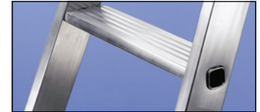
Mit rutschsicheren, geriffelten Stufen, 80 mm tief