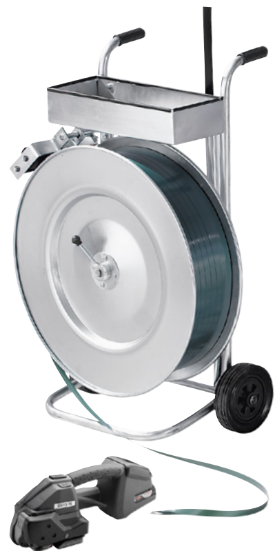
Alle Komponenten können einzeln nachbestellt werden.

Verschlussart: hülsenlos. Bandlänge: 1200 m. Ausführung Bandabroller: fahrbar, mit Ablagefach. Farbe Bandabroller: verzinkt. Kern-Ø: 406 mm.