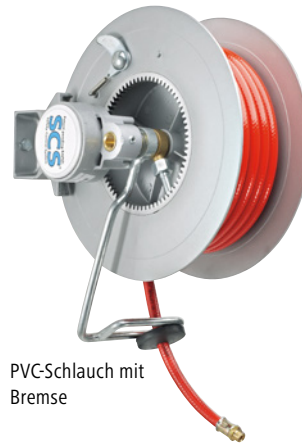
PVC-Schlauch mit Brems

Anwendungsbereich: für Luft. Max. Druck bis: 15 bar. Nennweite Schlauch: DN 10. Anschluss außen: G 3/8 Zoll. Gehäusematerial: Aluminiumguss. Befestigungsmöglichkeit: Befestigung an Wand, Decke, Boden, Maschinen und Fahrzeugen möglich. Mechanismus: Rückholfeder und Arretierungsmöglichkeit. Breite: 166 mm.