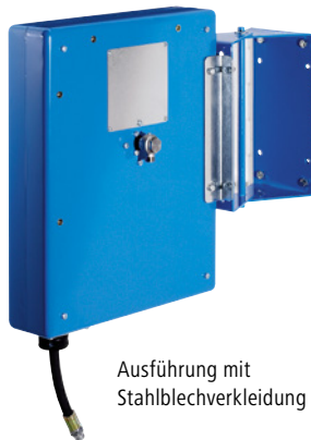
Ausführung mit Stahlblechverkleidung