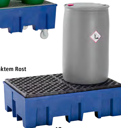
13 Mit PE-Rost