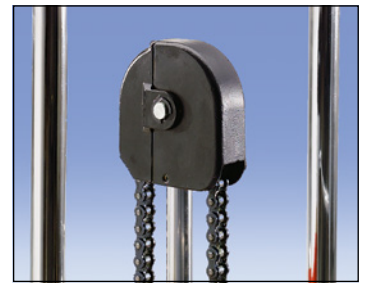
Hohe Sicherheit – abgedeckte Kettenumlenkung